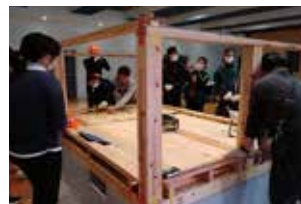
災害模型「泥出しクン」 を使った実演研修