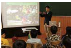
災害・防災に関する 講演会や研修講師

【講演内容キーワード】「九州北部豪雨」「東日本大震災」「災害ボランティアセンター」「防災」「ワークショップ」 など