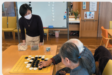
玉光苑デイサービスセンター 訪問