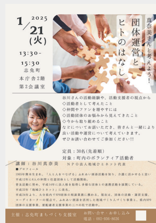
福岡県志免町 まちづくり支援室 リーフレット