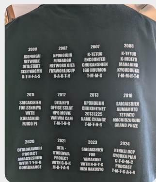
2000年からの活動をTシャツに表現