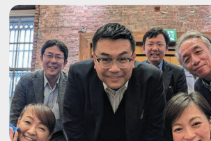
労働者協同組合 ワークズ コープ・センター事業団の皆様