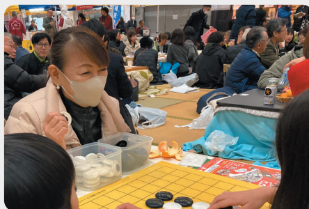
12/30 こたつでポン イベント参加