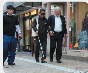
府内五番街にて視覚障がい者体験