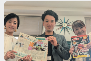
協働事例発表：(株) アシタエ