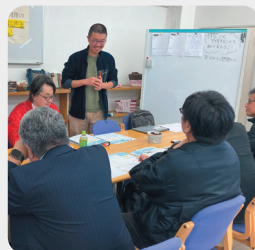
防災ワークショップ(パラボラ舎)