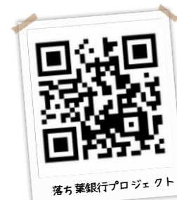
落ち葉銀行プロジェクト

9月の「みなとまつり」で文化交流事業を経て、10月からは「落ち葉銀行プロジェクト」の活動を本格化。流木や伐採枝を活用した落ち葉貯金箱をつくり、落ち葉を貯めて腐葉土をつくります。11月には福祉施設にて芋掘りイベントを通じて、地域の未利用資源を価値あるものへと変える「資源循環」の取り組みを広げています。