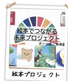
絵本プロジェクト

宇佐市内にある小学校へ出向き、紙漉きワークショップの出前授業を行いました。焼酎パックの損紙を材料にしたパルプで子どもたちが自分たちの手で紙すきを体験することで、環境への関心を育むとともに、アップサイクルへの理解を深める機会となりました。