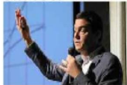
1月米に日本を訪れ、各種の講演を行った。