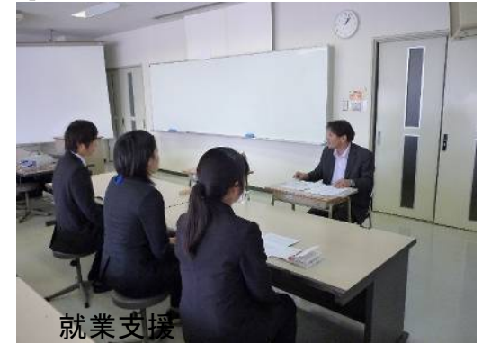
就業支援 キャリアカウンセリング