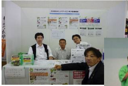
中小企業家同友会 ビジネス交流会