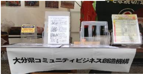
大分県コミュニティビジネス創造機構