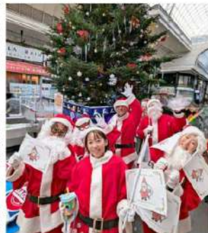
子どもたちにクリスマスの思い出を届けるチャリティーサンタ