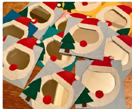
サンタさんミラー