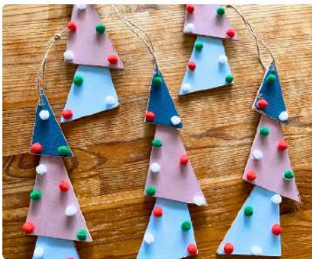
ツリーオーナメント