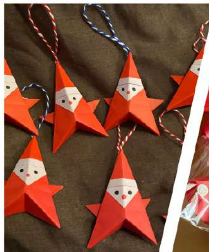
サンタさんオーナメント