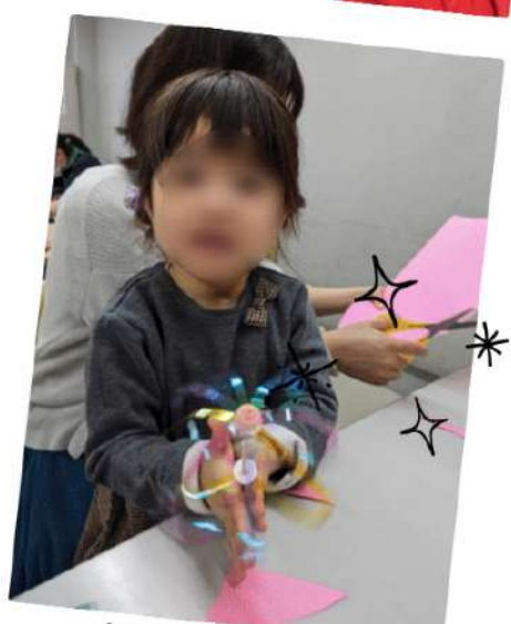
くるくるレイソボー