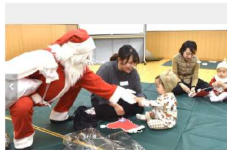
【トナカイ帽の子どもと握手するサンタ】中には声を上げて泣きだす子もいたが、サンタクロースの声掛けに次第に打ち解け、ハイタッチをしたりひげを触ったりして交流を楽しんだ。