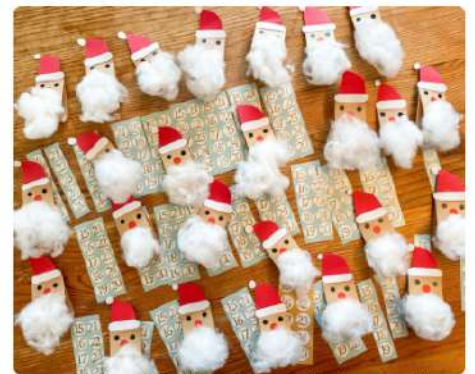
サンタさんアドベントカレンダー