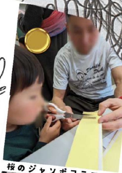
桜のジャッポフラワー