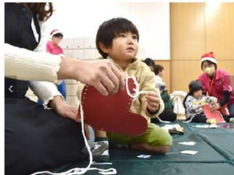
【大分市での子育て支援クリスマス会】今年初の親子の参加。撮影会やプレゼントを入れる紙の靴下製作などを楽しんだ。