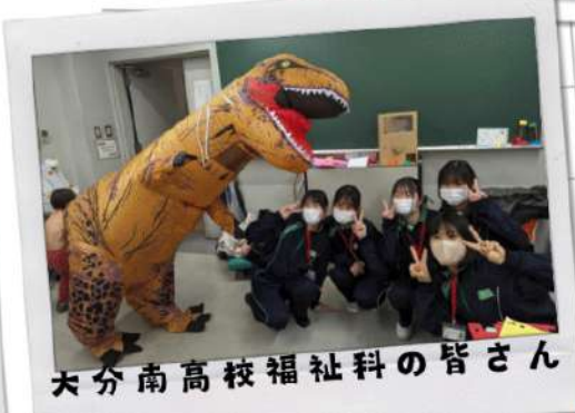
大分南高校福祉科の皆さん