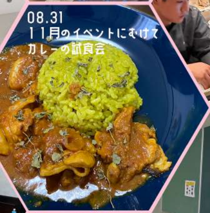
08.31 11月のイベントにむけて カレーの試食会