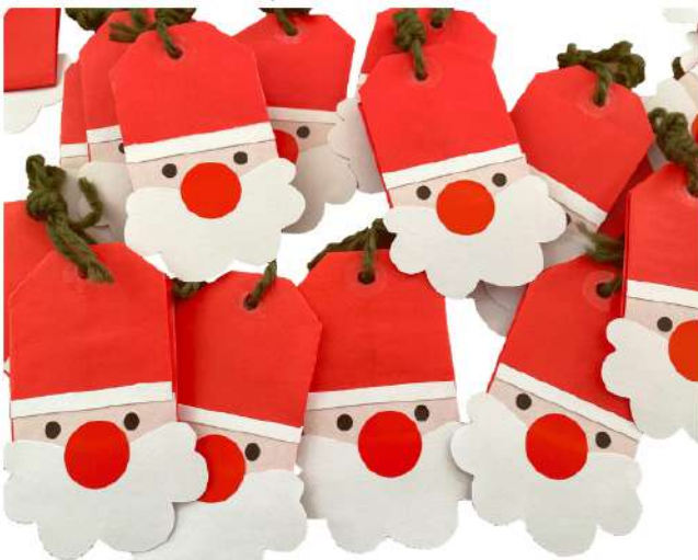
サンタさんお守り