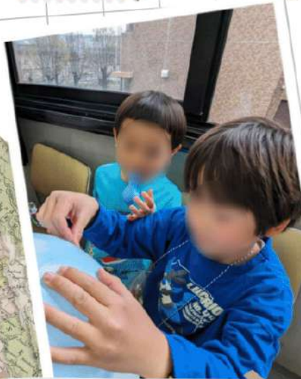
とことこ風船づくり