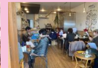
レンタルスペース