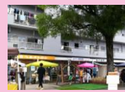
しきど青空マルシェ