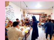
コミュニティカフェ