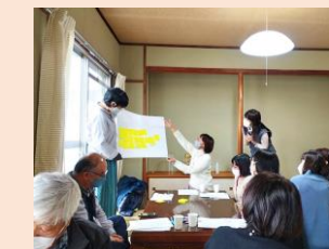
2022.12.17 第4回 基調講演：小さな手の活動 GWテーマ：パパラボ