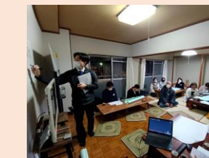
2023.2.10 第5回 基調講演：「えんがお」の活動 GWテーマ：コミュニティカフェ