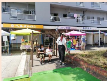
過去最多の27店舗が参加