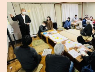
2022.11.30 第3回 基調講演：社会福祉士の事例 GWテーマ：ホームホスピス