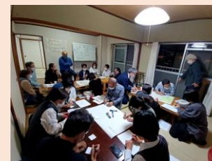
2022.10.24 第2回 基調講演：訪問看護の現場 GWテーマ：ホームホスピス