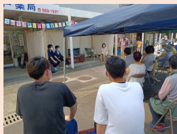
オンライン併用でシンポジウム