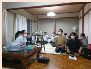
2022.9.27 第1回 基調講演：高齢者の孤独