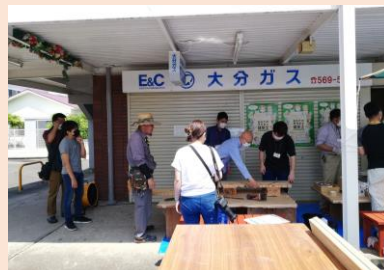
建築士会と大分大学のワークショップ