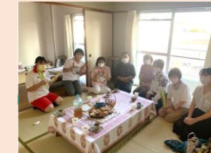
マンマたちのしゃべりバ manna project