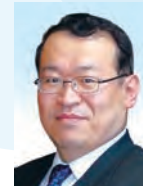
牧野 光朗 長野県飯田市長