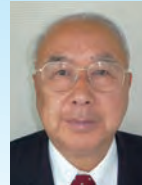
川添 健 鹿児島県長島町長