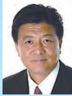
新藤 義孝 内閣府特命担当大臣 (地方分権改革)