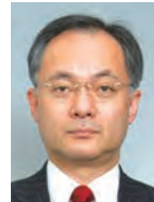
辻 琢也 一橋大学大学院 法学研究科 教授