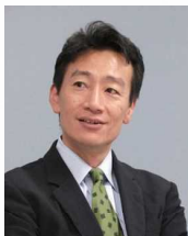
吉本 光宏 東京2020組織委員会文化・教育委員、 ニッセイ基礎研究所研究理事