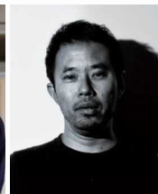
清川 進也 音楽家、プロデューサー