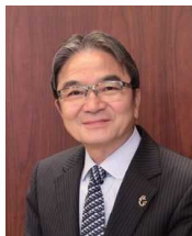
宮田 亮平 文化庁長官