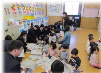
日本文理大学附属高等学校 主な活動: 清掃活動、出前授業、キャンドルナイト等

おおいたうつくし推進隊 154団体 うち、新規団体 105団体 若者中心の団体 28団体 (H31. 1. 31現在)