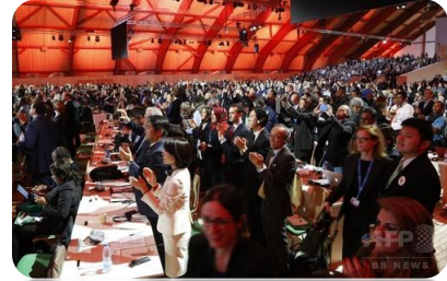
世界が喝采！ パリ協定

「地球温暖化(以下、温暖化)」のABCを学びませんか。温暖化の脅威は刻々と迫っています。「温暖化の現在と未来」「世界と日本の動向」等、リアルな学びをしながら、八丁原地熱発電所見学、「不都合な真実Ⅱ」の映画鑑賞、祖母・傾き・大崩エコパークの受講などを盛った気楽な「温暖化入門講座」です。